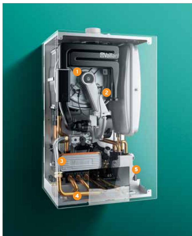
ecoTEC plus VCI, vue intérieure aux rayons X.

lors de la réouverture du robinet pour se rincer. Vous profitez ainsi d'un logement où il fait bon vivre, avec une température agréable et de l'eau chaude disponible rapidement dès que vous en avez besoin.